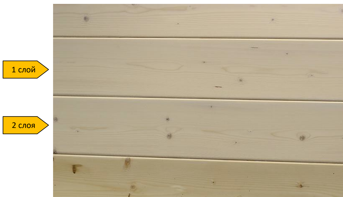
образцы с однослойным и двухслойным нанесением Woodwax

Adler Woodwax (арт.30720) можно применять в системе с Lignovit IG (арт53134). Оттенки Adler Woodwax см.на сайте www.adler-lacke.ru